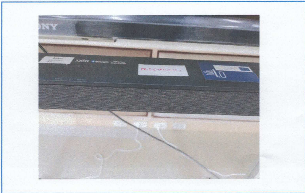
Figure 4. SOUNDBAR SONY HT-S350