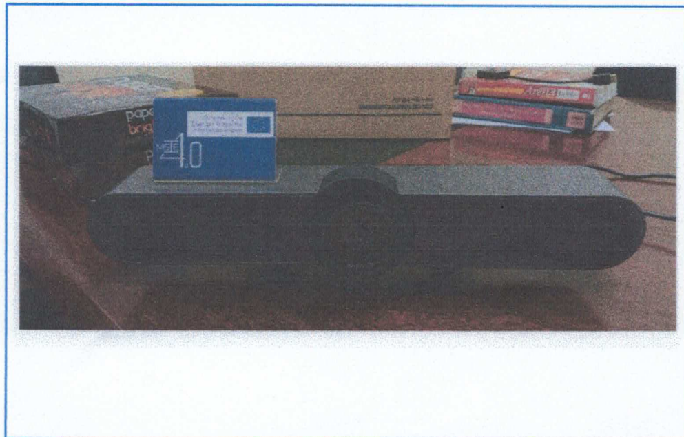
Figure 1. LOGITECH MEETUP