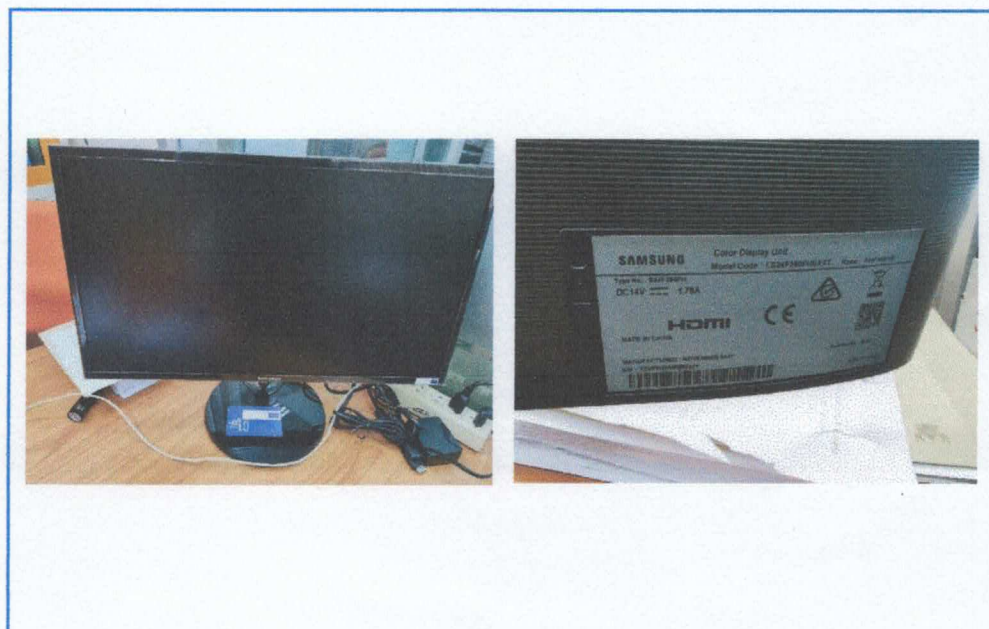
Figure 6. MONITOR SAMSUNG LED 23.5" LS24F350FHE