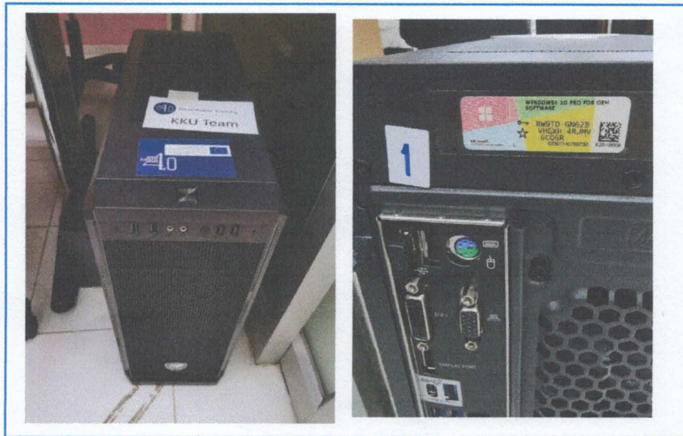
Figure 5. CPU INTEL 1151 CORE I5-9400F 2.90 GHZ MAINBOARD 1151 MSI Z390-A PRO 8 GB DDR4/2400 RAM PC APACER BLACK (X2) 1 TB HDD SEAGATE BARRACUDA 7200RPM SATA3 CASE COUGAR MX330-X POWER SUPPLYCORSAIR 550W VS550 VGA GIGABYTE QUADRO P620 2GB DDR5