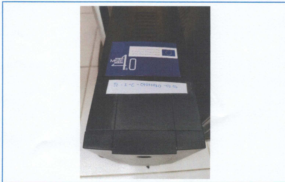
Figure 7. UPS APC BACK (700VA/390WATTS)