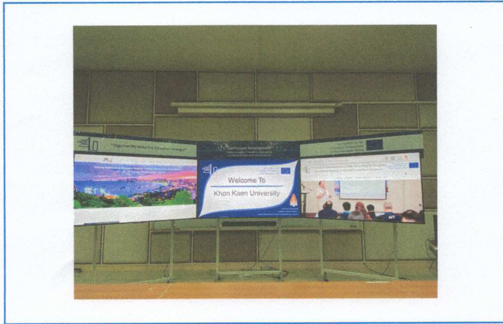
Figure 3. LED TV 75 SONY 4K ANDROID DTV KD-75X800